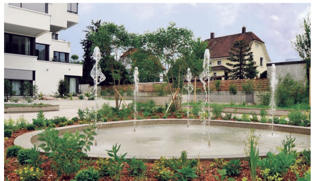
...in einer parkähnlichen Umgebung und...

Wer in diesem Umfeld seine Finanzierung selber regeln möchte, benötigt viel Zeit, Geduld und eine grosse Bereitschaft, weite Wege in Kauf zu