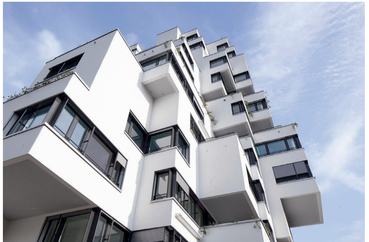
Leben in einer zukunftsweisenden Form mit einem auf individuelle Bedürfnisse ausgerichteten Wohnkonzept...

Der Stoll-Turm in Münchenstein überzeugt mit seinem individuellen, bedürfnisgerechten Wohnkonzept, ergänzt mit vielfältigen Serviceleistungen. Neben den Facility-Services, Kleider- und Textilreinigung oder Wohnungsbetreuung während Ferienabwesenheiten gehören weitere Kultur- und Freizeitangebote, die freie Benutzung der Stoll-Lounge, das hauseigene Intranet oder die Dienste der Stoll-Managerin.