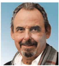
Jürg Bühler Kommunikation Gewerbeverein Münchenstein